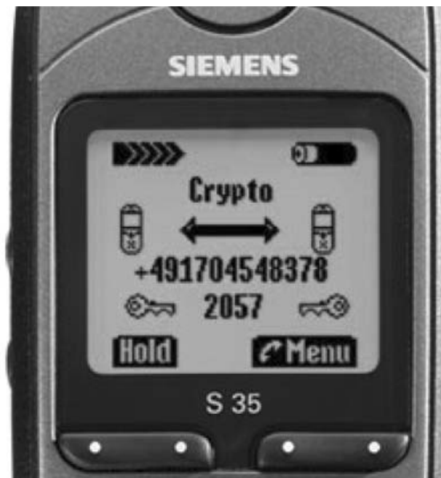
Bild 82: Das Display des TopSec GSM zeigt ein verschlüsseltes Gespräch an